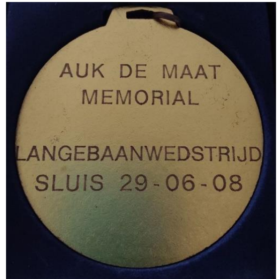
Herinneringsmedaille Auk de Maat