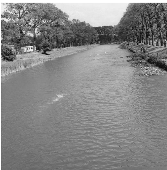
Zwemparcours Hoeke-Sluis met velden waterlelies. 1974