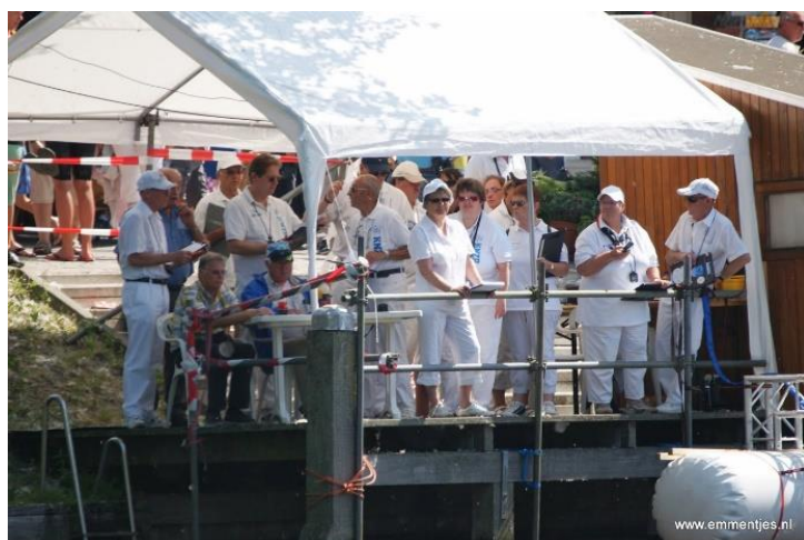
2013, jurykorps paraat aan de finish