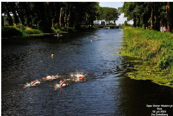
5 km vrije slag dames

===== 2023, Het aantal individuele starts in de afgelopen zes jaar schommelde tussen de 234 en 300. Alleen in 2022 waren het er minder: 217. Wedstrijdsecretaresse Myriam Hamelink-van Poecke daarover; "Hoewel het moeilijk vast te stellen is dat corona de reden is, lijkt het toch wel alsof iedereen in 2022 weer een beetje moest opstarten". =====