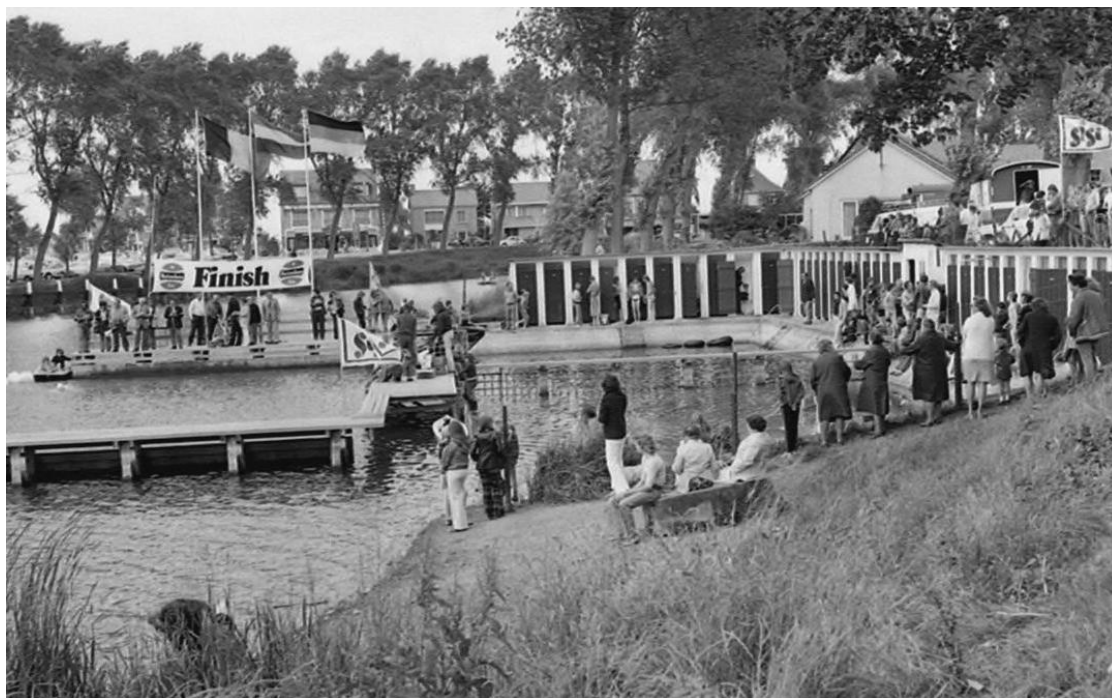
Start en finish zwembad aan de Kalkboei.