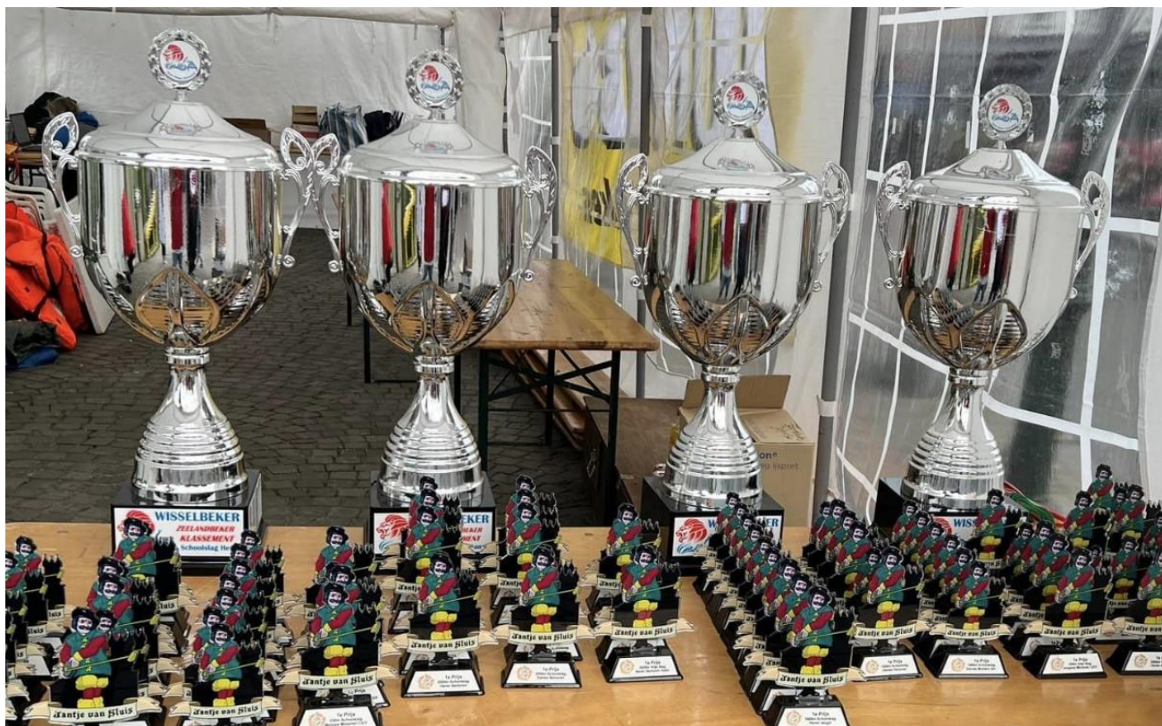
2023: prijzentafel met de vier grote permanente Zeelandbeker

De Zwemkroniekbeker ging naar degene die het snelste was over 10 km. (de beste twee 2km plus twee 3km). Keuze genoeg, want tot medio de tachtiger jaren werden vrijwel uitsluitend de klassieke afstanden 2 km en 3 km gezwommen. Doordat steeds vaker andere afstanden op de zwemprogramma's kwamen voldeed het Zwemkroniekbekersysteem niet langer. Als resultaat van het overleg tussen de Werkgroep Open Water Zwemmen en Guus Razoux Schultz, die daarvoor een computerprogramma had ontwikkeld, werd daarom per 1989 een puntensysteem naar achterstand per kilometer op de dagwinnaar ingevoerd. Ook voor de Zeelandbeker ging men toen over op deze rekenmethode. Met ingang van 2018 werden naar een idee en op initiatief van Jos Nijskens & Wietse Beerens, met dank aan 'Ivenssport' als sponsor, de grote permanente Zeelandbeker geïntroduceerd voor de vier hoofdcategorieën. (zie foto prijzentafel Sluis). Dit met het doel de deelname aan het Zeelandbekerklassement te blijven stimuleren. Dankzij Arjan Dekker en Piet Schop konden alle namen van de eerdere winnaars en winnaressen worden achterhaald en in de bekertjes worden gegraveerd.