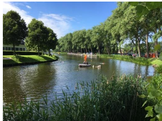
2023: laatste bocht naar de finish